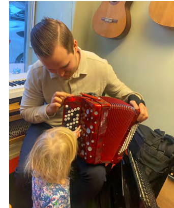
SU 7.5. 10-14 Kallion musiikkikoulun Avoimien ovien päivä.

Teatteri Kultsan Improverttien pitkän impron demoesitys Syksyllä 2022 Teatteri Kultsaan perustettu pitkän impron ryhmä Improvertit kutsuu kaikkia improvisaatiosta kiinnostuneita seuraamaan demoesitystä Teatteri Kultsaan (Käenkuja 6-8). Pitkässä improssa kokonainen näytelmä musiikin kera syntyy lavalle esiintyjien improvisoina! Tilaisuuteen on vapaa pääsy (paikkoja rajoitetusti). Tervetuloa katsomoon! Esteetön.