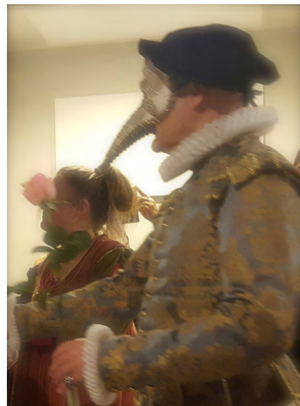
LA 13.5. 16-17 Renessanssitanssiperformanssi