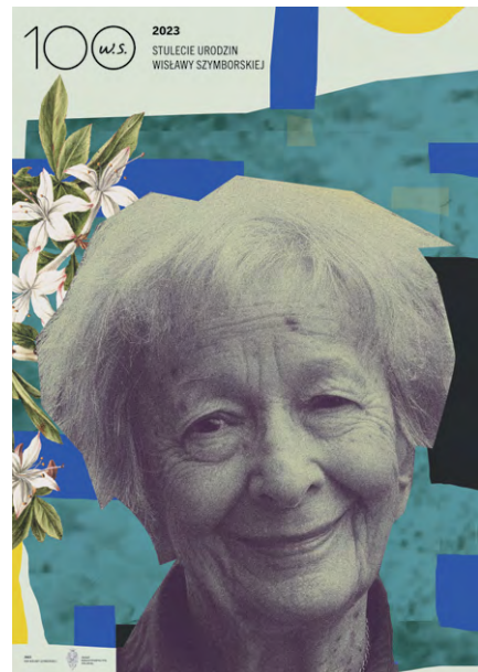
KE 10.5. 18.00 Runoilta Wisława Szymborskan parissa