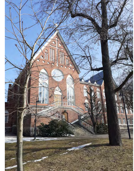
TO 11.5. 16.30 Opastus Diakonissalaitoksen kortteliin ja sen 155 -vuotiseen historiaan

Suomen kielen keskustelukahvila on kaikille avoin, rento tilaisuus, missä ei tarvitse jännittää. Toivomme, että osaat jo hiukan ennestään. Vapaa pääsy. Esteetön kulku Porthaninkadun kautta.