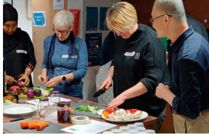
TO 11.5. 17-20 Makumatkoja suomeksi

STURENK. 11 Makumatkoja suomeksi Joka toinen torstai Kalliolassa tutkaillaan kulttuureita ja opitaan suomen kieltä ruuanlaiton ja makujen kautta. Monikulttuurisessa illassa tehdään ruokaa yhdessä, syödään ja tutustutaan eri puolilta maailmaa tuleviin ihmisiin. Kaikille avoimia ryhmiä järjestävät Kalliolan vapaaehtoiset. Vapaa pääsy! Esteetön tila.