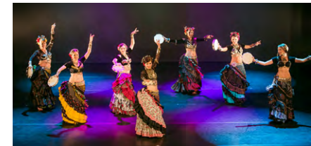
LA 6.5. 14-15.30 TribalDance

Huomio. Säävaraus! Tarkista vielä aikataulu ja ohjelma: www.kallionkulttuuriverkosto.fi