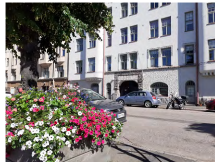
LA 13.5. 15.00 The Kallio Zig Zag - walking tour

KLO 22 KOKO TEATTERI, HÄMEENTIE 3 It's crazy, it's party - Euroviisuvalvojaiset. Juhlitaan räväkästi ja kannustetaan Käärijä voittoon! Valvojaiset alkavat heti esityksen jälkeen Seitsemän metrin screenimme on täydellinen viisujen seuraamiseen. Kisakatsomo ja aulaabaari suljetaan euroviisulähetysten jälkeen. Tilaisuus on maksuton, mutta sinne vaaditaan ennakkoilmoituminen www.kokoteatteri.fi/event-details/kokoteatterin-viisuvalvojaiset . Esteetön pääsy, mutta tarvitaan ilmoitus ennakoon bookings@kokoteatteri.fi www.kokoteatteri.fi/esteettomyys