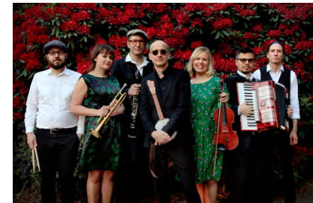
LA 6.5. 17.00 Vallilan Tango

tanssittaa kaikkia puistossa Vallilan Tango soittaa nostalgista (perinteistä) suomalaista tanssimusiikkia. Perinteiset lavatanssityylit kattava ohjelmisto koostuu suomalaisen iskelmän kultakauden tutuista ja harvemmin kuulluista kappaleista. Tanssitaan kaikki yhdessä!